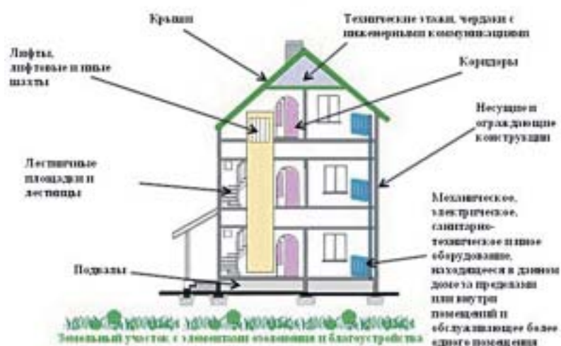
Состав общего имущества в доме

грамотно содержать. От качества управления зависит комфортность проживания в доме, потребительская стоимость каждой отдельной квартиры и нежилого помещения.