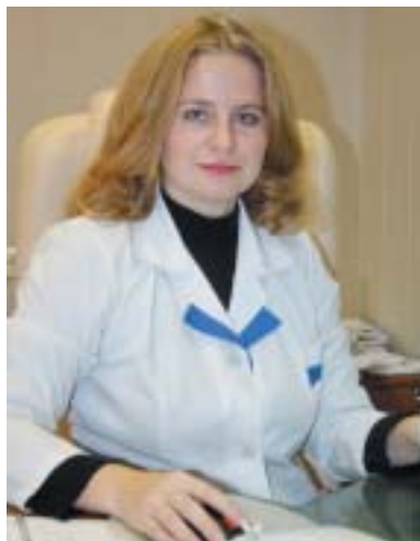
Снимок сердца – в один клик

Метод УЗИ-диагностики давно получил широкое распространение во всем мире. Лидирующие позиции по использованию данного оборудования занимает Япония. В Стране восходящего солнца созданы передвижные УЗИ-лаборатории, при помощи которых это диагностическое исследование проходят жители населенных пунктов, расположенных в отдалении от крупных городов. Как следствие, в Японии фиксируется самый низкий процент онкологических заболеваний.